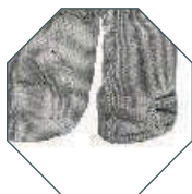
Nogawki bez elastycznego mankietu