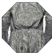
Gumka w pasie